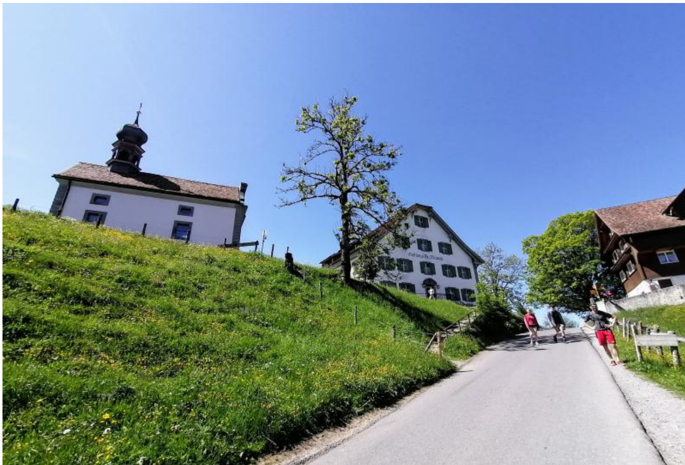
Schwyz / Schwyz