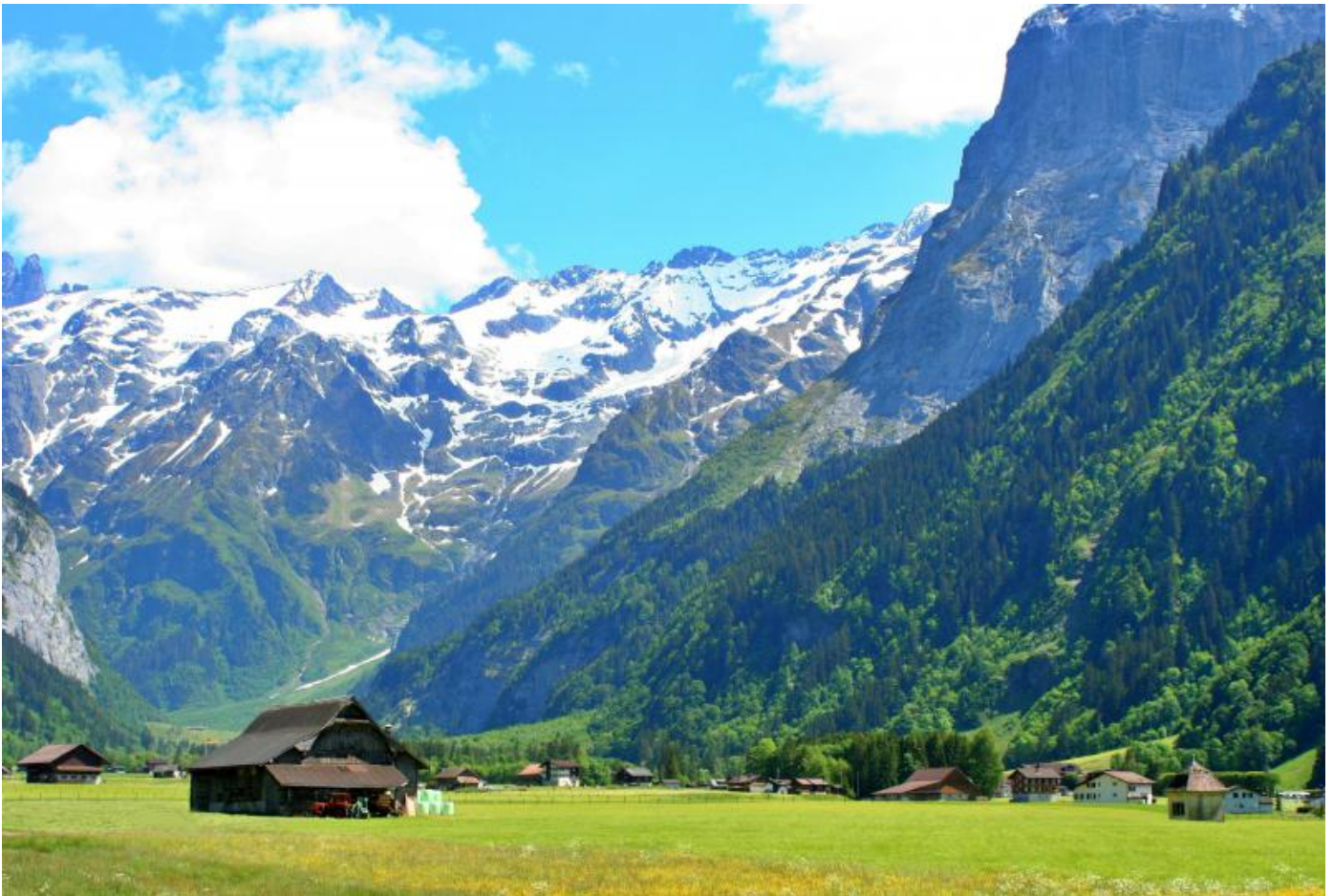
Engelberg / Obwalden